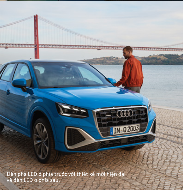
Đèn pha LED ở phía trước với thiết kế mới hiện đại và đèn LED ở phía sau.