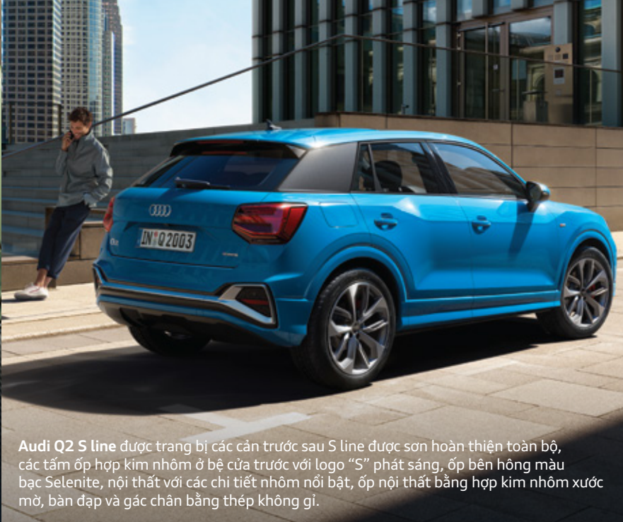
Audi Q2 S line được trang bị các cản trước sau S line được sơn hoàn thiện toàn bộ, các tấm ốp hợp kim nhôm ở bệ cửa trước với logo "S" phát sáng, ốp bên hông màu bạc Selenite, nội thất với các chi tiết nhôm nổi bật, ốp nội thất bằng hợp kim nhôm xước mờ, bàn đạp và gác chân bằng thép không gỉ.