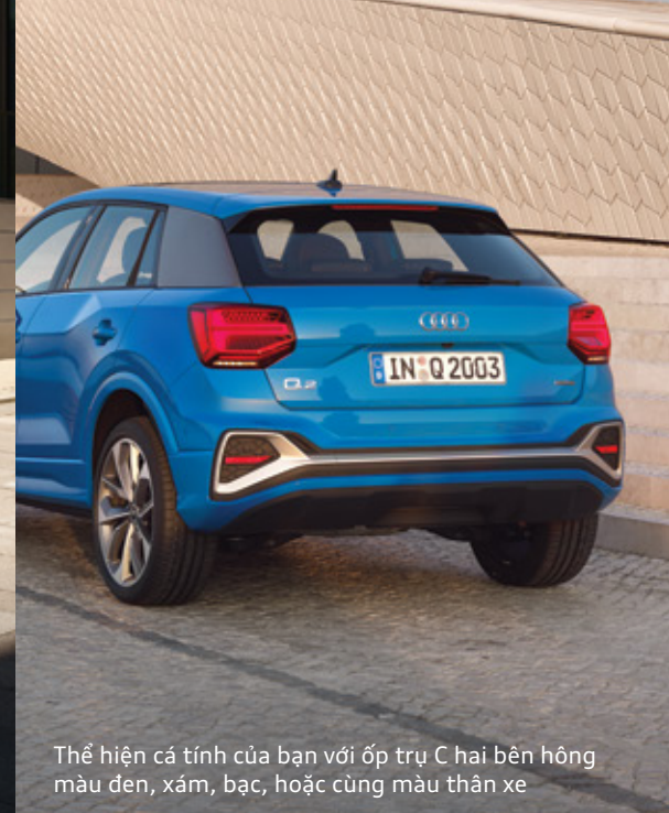
Thể hiện cá tính của bạn với ốp trụ C hai bên hông màu đen, xám, bạc, hoặc cùng màu thân xe