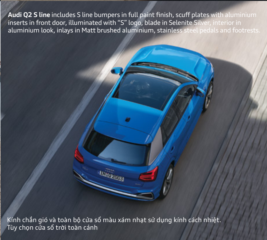
Audi Q2 S line includes S line bumpers in full paint finish, scuff plates with aluminium inserts in front door, illuminated with "S" logo, blade in Selenite Silver, interior in aluminium look, inlays in Matt brushed aluminium, stainless steel pedals and footrests.