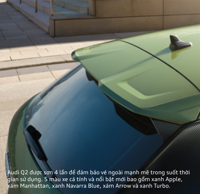
Audi Q2 được sơn 4 lần để đảm bảo vẻ ngoài mạnh mẽ trong suốt thời gian sử dụng. 5 màu xe cá tính và nổi bật mới bao gồm xanh Apple, xám Manhattan, xanh Navarra Blue, xám Arrow và xanh Turbo.