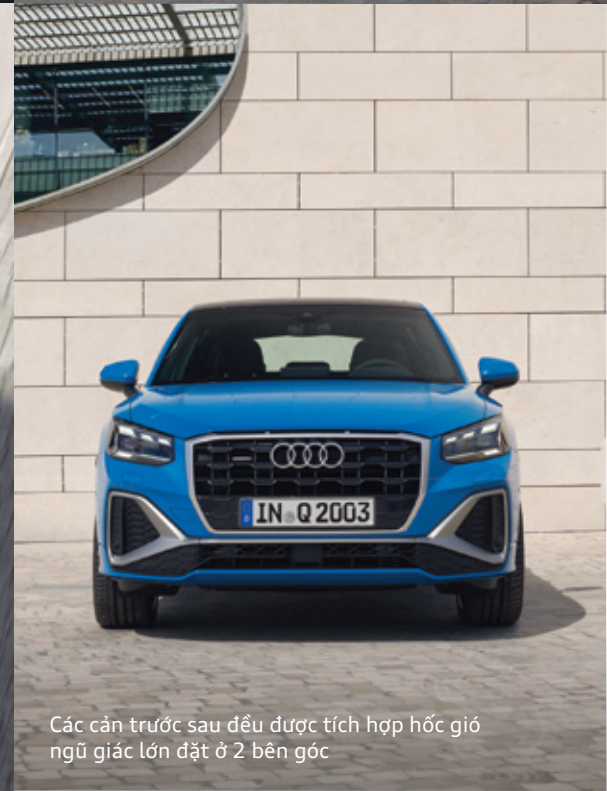
Các cản trước sau đều được tích hợp hốc gió ngũ giác lớn đặt ở 2 bên góc